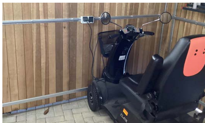
LED verlichting, oplegplank en stopcontacten