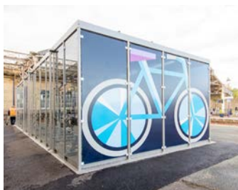
Trespa beplating bestickerd