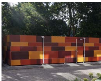
Trespa beplating in wildverband