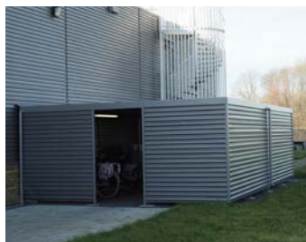
SCH Dune beplating