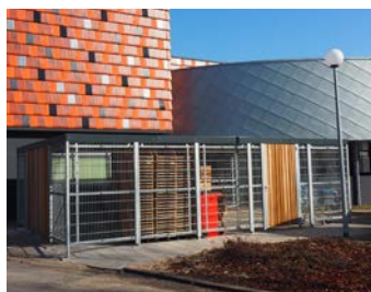
Zijwanden van traliepanelen, deuren van hout